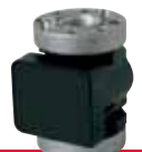
Oval gear pulse meter Optional